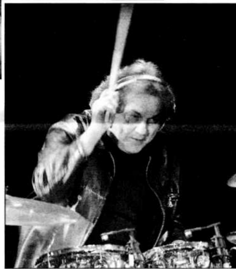
De Piscopo si esibirà live in piazza Matteotti

Ovviamente il calendario di eventi è ben più fitto e si sviluppa al di là dei tre atout della manifestazione.